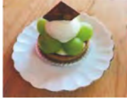
▲シャインマスカットのタルト (¥540)

中に大きな栗が入っているだけでなく、マロンクリームの中にも小さな栗が！口の中いっばいに栗の風味が広がり、とてもおいしかったです☆