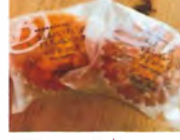
▲おおいたはちみつマドレーヌ (¥194)

シャインマスカットが大好きな私にとって、至福のケーキでした！中のクリームのところどころ感と、タルト部分のサクッと感が絶妙にマッチしていました☆