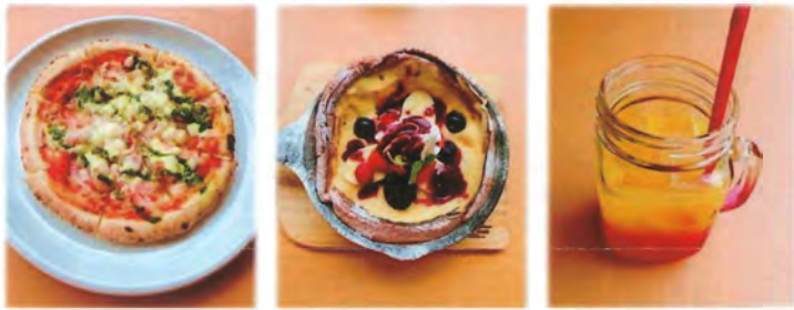
▲海鮮トマト「ザル」ピザ 1,200円 ▲パンケーキ(カスタードベリー) 790円 ▲ソング-ジュース 450円

今回は、ピザとパンケーキを注文しました！ピザは海鮮をたっぷり使用しており、トマトソースとバジルとの相性も抜群でとても美味しかったです♪パンケーキは周りがカリカリで中がとろとろの生地の上に、カスタードクリームや生クリームとベリーがたくさんあって甘みと酸味のバランスが良くとても美味しかったです♡