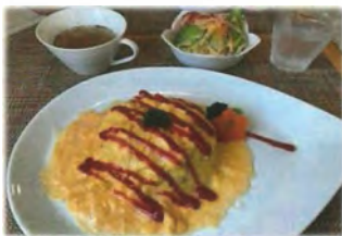
▲オムライス【ランチセット】 (スープ・サラダ・烏龍茶orコーヒー)