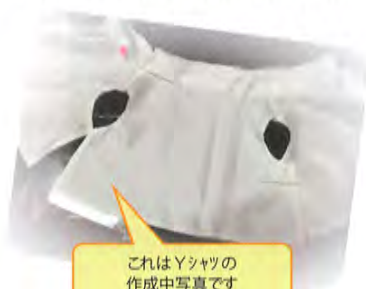
これはTシャツの作成中写真です