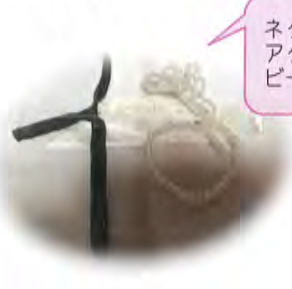
ネクタイ等装飾品です。アクセサリは、100均のビーズと針金で作成しました